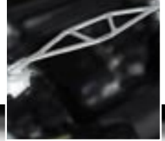
AC Schnitzer Federbeinbrücke erhöht die Verwindungssteifigkeit des Vorderwagens.