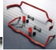
AC Schnitzer Spezial Stabilisatorsatz, 2-fach verstellbar.