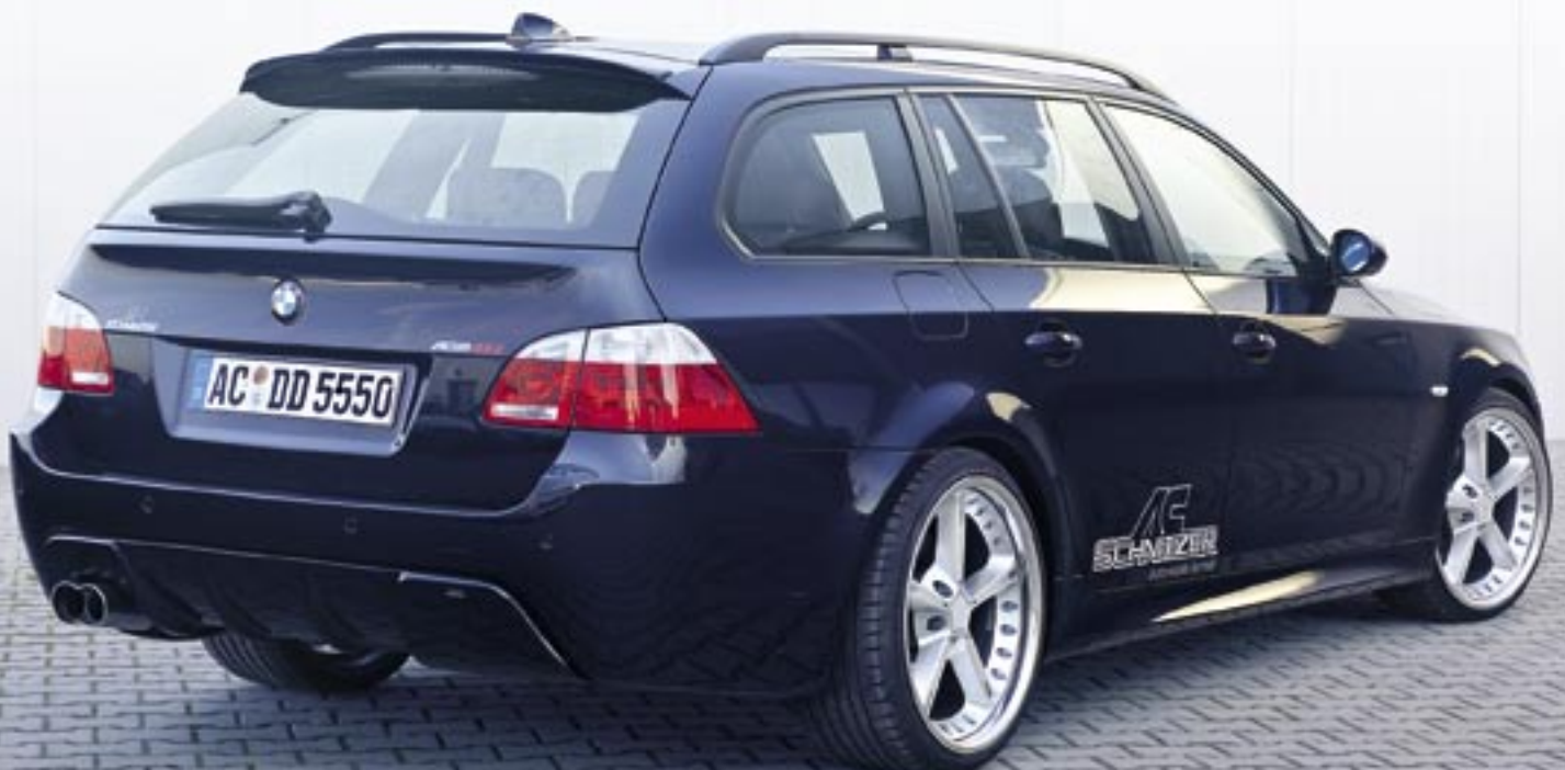
(Bilder unten M-Technik Umbau)