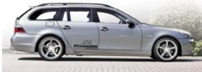
Auf Maß geschnitten: Dachheckspoiler und Heckschürze greifen die Linienführung des Serienfahrzeugs auf und führen sie mit sportlichem Akzent weiter.