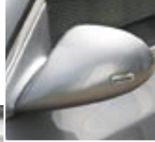
AC Schnitzer Sportspiegel.