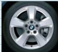
25D (styling 243)