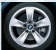
2SE (styling 246)