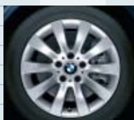
2HH (styling 244)