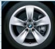
2SE (styling 246)