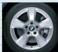
2SD (styling 243)