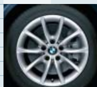
2KM (styling 245)