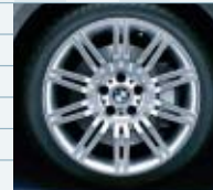
2NN (styling 172M)