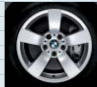
589 (styling 122)