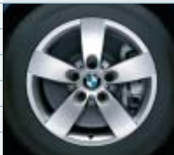
2SB (styling 242)