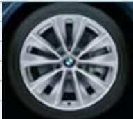
2BS (styling 247)