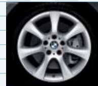
591 (styling 124)