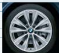
2BS (styling 247)