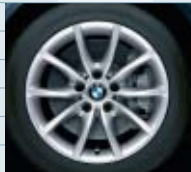
2KM (styling 245)