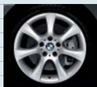
2C0 (styling 124)