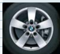
2SB (styling 242)