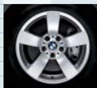
589 (styling 122)

• = optie s = standaard - = niet mogelijk