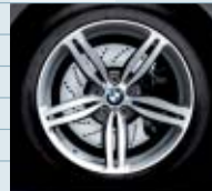
2MB (styling 167M)