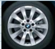
2HH (styling 244)