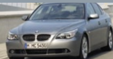
BMW 5 Series