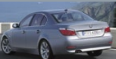
BMW 5 Series

The BMW 5 Series harman/kardon LOGIC7® Multi-Channel Audio System: A new standard in acoustic realism.